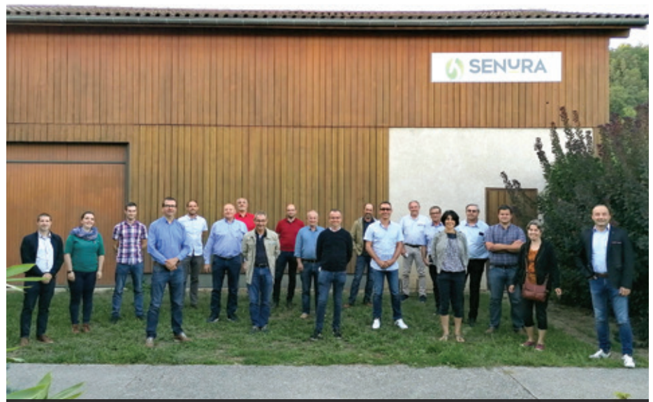
Les 2 et 3 septembre 2020, l'IRFEL s'est réuni en Conseil d'administration à la Senura, station experte de la noix dans l'Isère.